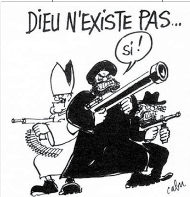
تیتو: خدا وجود ندارد... جواب: چرا!

با استفاده از فضایی که به وجود آمده، تبلیغ ایدئولوژیک و کار بسیج را در مراکز محروم و فضاها رسانه‌ای دنیا به پیش می‌برند. آن‌ها دارند بر پایه تعصب و تاریک‌اندیشی برای پیشبرد منافع استراتژیک و طرح‌های گسترش نفوذ منطقه‌ای و جهانی خود، نیرو جمع می‌کنند. القاعده و داعش و ده‌ها نام آشنا و ناآشنای دیگری که تا به حال