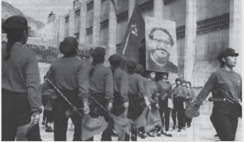
زنان کمونیست زندانی در پرو (۱۹۹۱)

اهمیت و جایگاه تاریخی جنگ خلق در پرو تحت رهبری حزب کمونیست آن کشور اما در اسناد تاریخی و در حافظه بسیاری از مردم و کمونیست‌های انقلابی دنیا مدون و تثبیت شده است. در پرتو این تجربه انقلابی، سیاست کسب قدرت سیاسی توسط پرولتاریا و انجام پیشروی‌های انقلابی که در نتیجه شکست سوسیالیسم در چین کم‌رنگ و مخدوش شده بود دوباره قدرت گرفت. حزب کمونیست پرو کوشید پرچم مائو تسه دون را در مواجهه با احیای سرمایه‌داری در چین و بحرانی که جنبش بین‌المللی کمونیستی را فراگرفت بالا نگه دارد. این حزب با اتکا به تئوری جنگ خلق مائو سال‌ها در میان روستائیان فقیر و بی زمین فعالیت تبلیغی - ترویجی و تشکیلاتی کرد؛ در اول ماه مه ۱۹۸۰ (۱۳۵۹) جنگ را با امکانات اندک آغاز کرد؛ چندین بار تا مرز نابودی پیش رفت ولی هر بار قوی‌تر بیرون آمد و تعداد بیشتری از دهقانان و کارگران و جوانان را به صفوف خود کشید. ایدئولوژی رهایی بخشی که این جنگ را هدایت می‌کرد بیش از هر چیز در شرکت وسیع زنان در این جنگ تبارز می‌یافت. هیچ کجای تاریخ مبارزات مسلحانه چنین شرکت فعالی از جانب زنان و در رده‌های مختلف رهبران و کادرهای حزبی، فرماندهان نظامی و رزمندگان مسلح را به