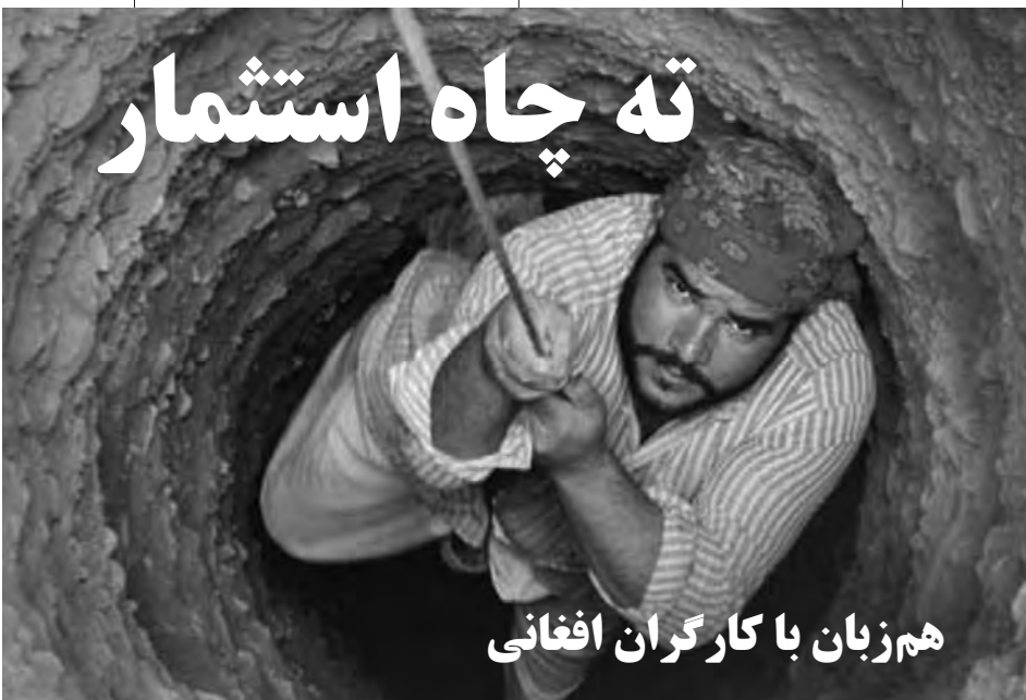
هم‌زبان با کارگران افغانی

اوضاع زندگی چگونه؟ - معمولاً در خانواده‌های افغانی ساکن ایران چند نفر کار می‌کنن تا خرجی رو در بیان. پدرم، من و دو برادرم کارگری می‌کنیم تا بتونیم خرج غذا، اجاره‌خونه، آب‌وبرق و کرایه ماشین در بیاریم. برای