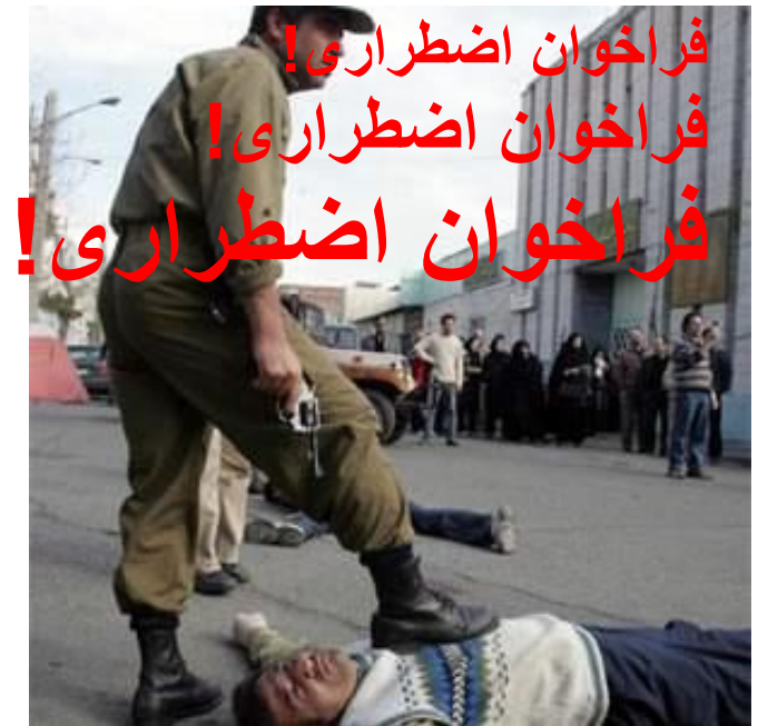
نامه ارسالی برای نشریه دانشجویی بذر - ۱۲ تیر ۱۳۸۸

در مورد دستگیر شدگان خیزش مردم، خبرهای دهشتناکی از زندان های رسمی و بازداشتگاه های مخفی و موقتی در گوشه و کنار می رسد. شرایط ایجاب می کند که يك جنبش همگانی برای افشای جنایاتی که در حال رخ دادن است و آزادی فوری و بدون قید و شرط همه زندانیان سیاسی فراخوان داده شود. در ایران، خانواده های زندانیان سیاسی از قدیم و جدید می توانند محرك و هسته مرکزی چنین کاری شوند. ولی در شرایط کنونی خارج از کشور می تواند و باید نقش مهمی در این زمینه بازی کند. حتی کارزار سالانه یادبود کشتار ۶۷ می تواند به عرصه ای برای این جنبش تبدیل شود.