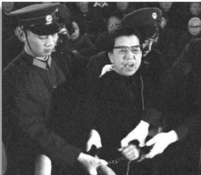
▲ چیان چن با فریاد زنده باد انقلاب دادگاه کودتاچیان را به هم می‌ریزد. ۱۹۷۷

صحت داشته و قابل اثبات و قابل دفاع هستند، ثانیاً در عرصه‌ی پراتیک ۱۶۰ سال مبارزه‌ی طبقاتی پرولتاریا، دو انقلاب پیروزمند روسیه و چین و سپس در تجربه‌ی دولت سوسیالیستی اتحاد شوروی و چین سوسیالیستی در عمل سنجیده شده و عمده بودن دستاوردها و فرعی بودن کمبودهای آن‌ها به اثبات رسیده است. اینکه در جریان مبارزه و جنگ طبقاتی، انقلاب‌های بنا شده و پیشروی کرده بر اساس نظرات مارکس، لنین و مائو، شکست خوردند عمدتاً به عوامل گوناگون عینی در تناسب قوای داخلی و بین‌المللی میان پرولتاریا و بورژوازی ارتباط داشت و نه عدم صحت تئوری‌های کمونیستی یا اشتباهات رهبران کمونیست. چنانکه مائو گفت: